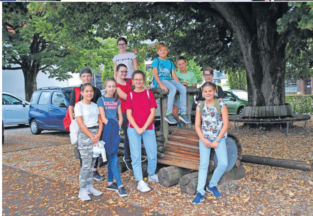
Für Sie unterwegs war: AareGäuer Nachhilfe