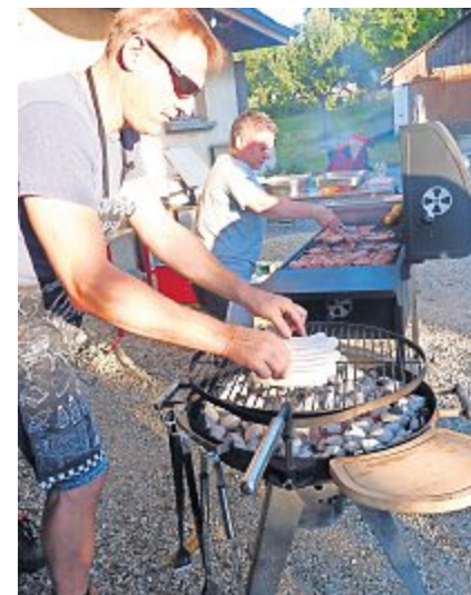
Die Helferinnen und Helfer hatten sichtlich Freude daran, Corona symbolisch den Garaus zu machen.