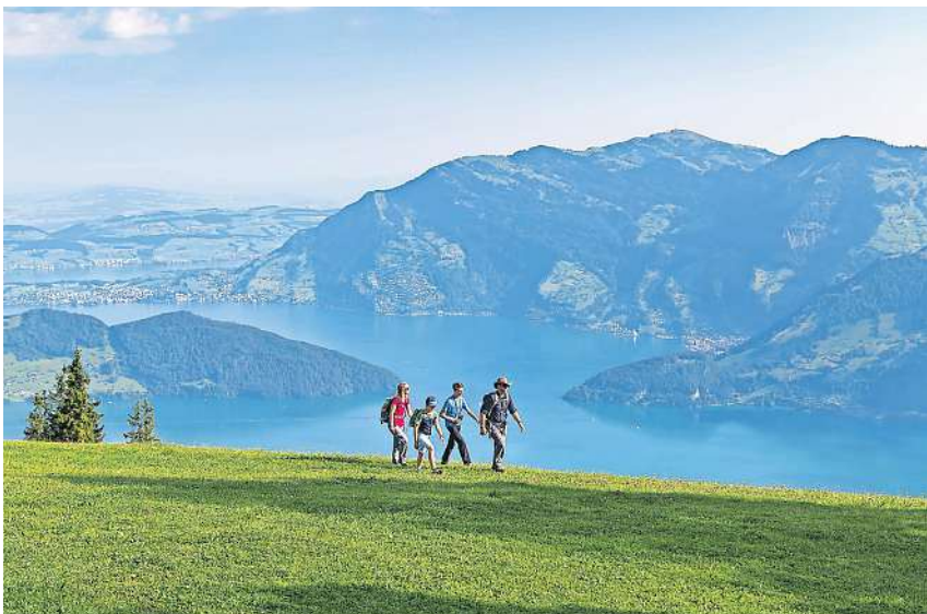
Wandern im Herzen der Zentralschweiz mit herrlicher Aussicht auf See und Berge.